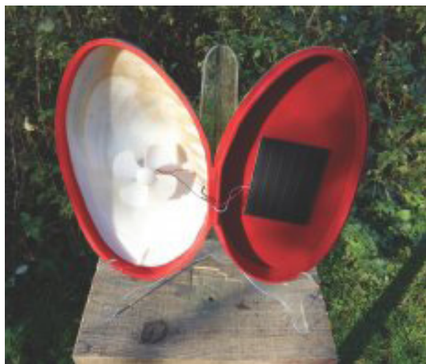
Air de par ici, 2012